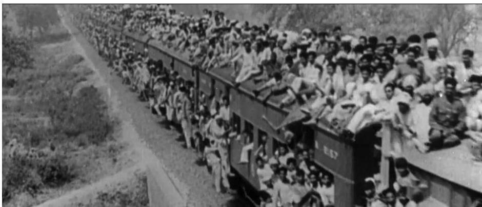
Figura 10. Registro verídico de deslocamento em massa de indianos após noticiada a divisão do país

Fonte: O ÚLTIMO VICE-REI. Direção: Gurinder Chadha. 2017.