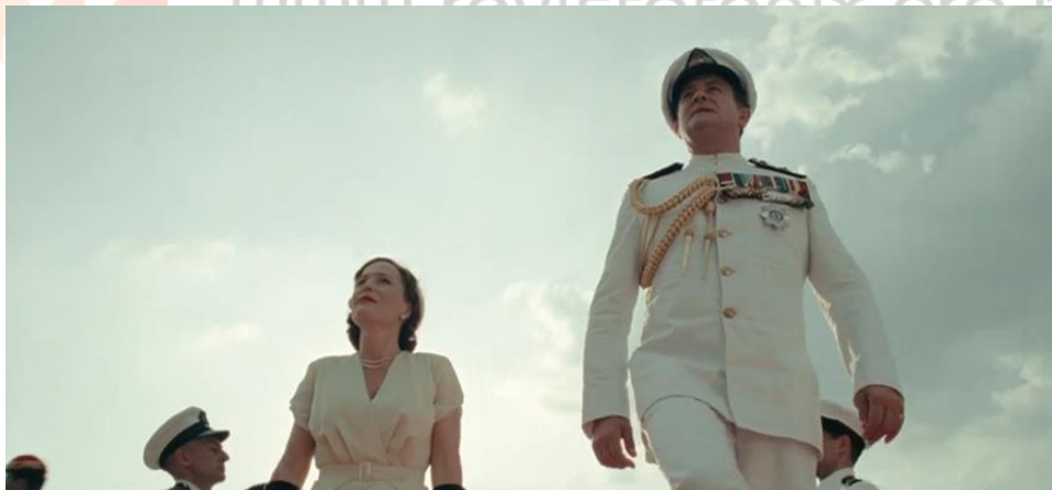
Figura 2. Família real se direciona ao palácio

Fonte: O ÚLTIMO VICE-REI. Direção: Gurinder Chadha. 2017.