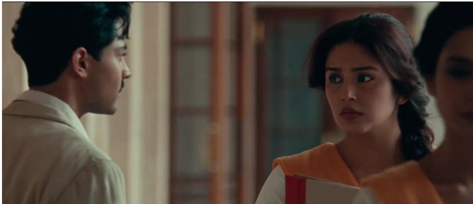
Figura 4. Reencontro de Kumar e Aalia -Parte II

Fonte: O ÚLTIMO VICE-REI. Direção: Gurinder Chadha. 2017.