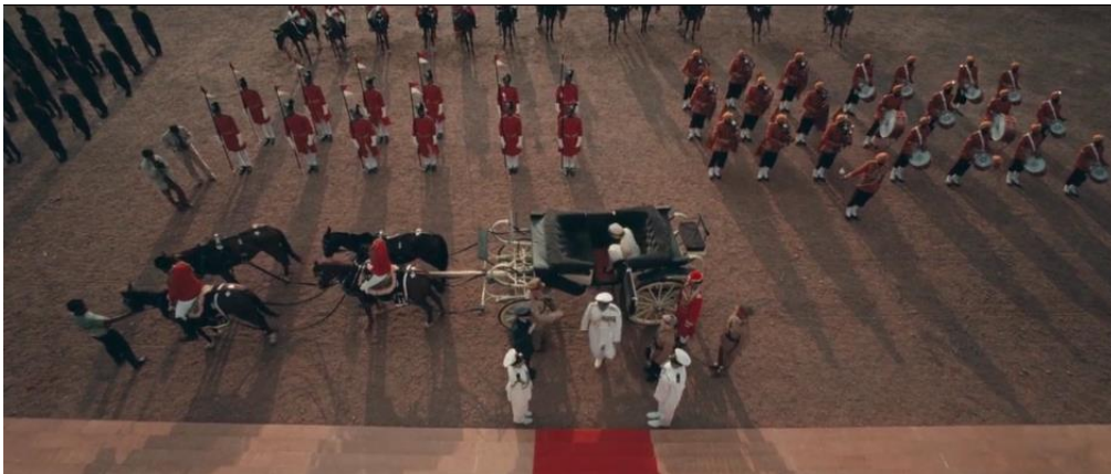
Figura 1. Chegada da família real ao palácio