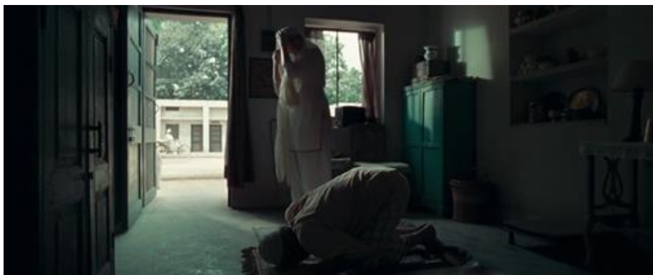
Figura 6. Elementos simbólicos da religião muçulmana