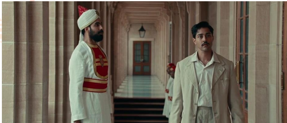
Figura 3. Reencontro de Kumar e Aalia - Parte I